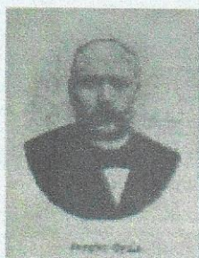
1. Jungfer Gyula 1841. január 9. – 1908. november 21.