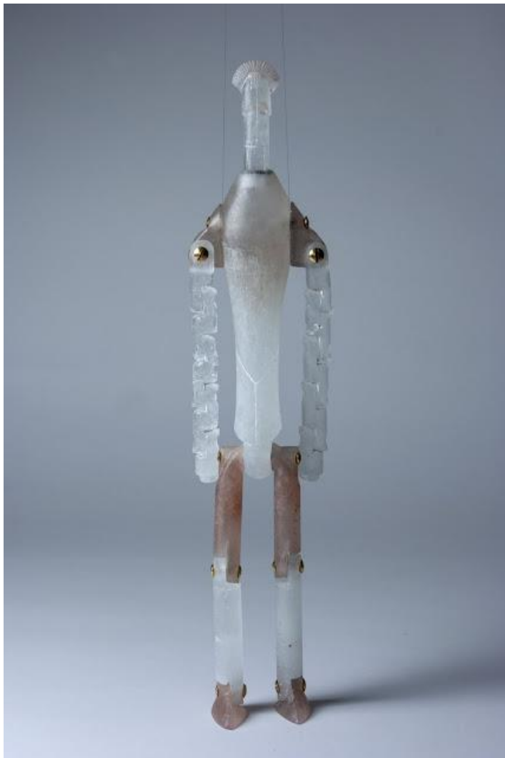
6. kép – Budai Zsolt János: Ms. White , 2019–2022

Forrás: http://www.budaizsoltjanos.com/2020/01/ms-white-uveg-robot-glass-robot.html – Hozzáférés: 2022. november 21.