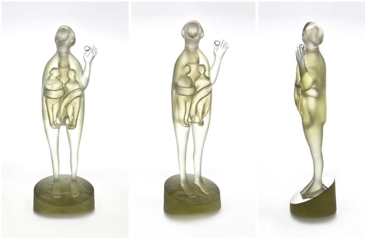
1–3. kép – Sipos Balázs: Nő almával , 2014