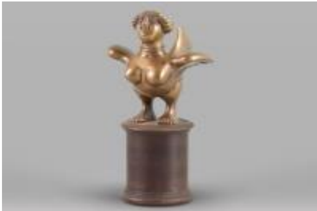
7. kép – Péter Vladimír: Madáranya

Forrás: https://axioart.com/tetel/peter-vladimir-madaranya_489785 – Hozzáférés: 2022. november 21.