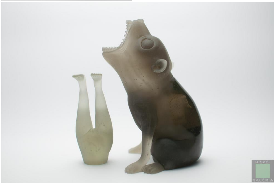
12–13. kép – Sipos Balázs: Nyami , 2007