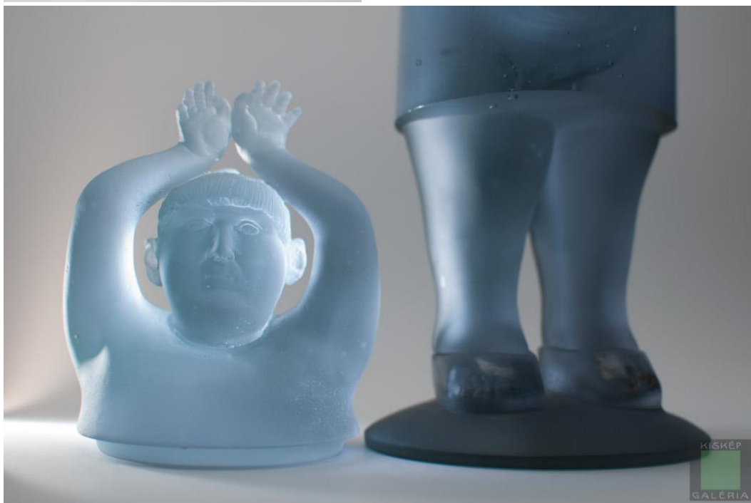
14–15. Sipos Balázs: Suzie , 2006