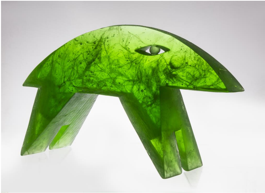
5. kép – Melcher Mihály: Zöld disznó , 1997 Iparművészeti Múzeum, Kerámia- és Üveggyűjtemény Forrás: https://gyujtemeny.imm.hu/gyujtemeny/uvegplasztika-zold-diszno/1336 – Hozzáférés: 2022. november 21.